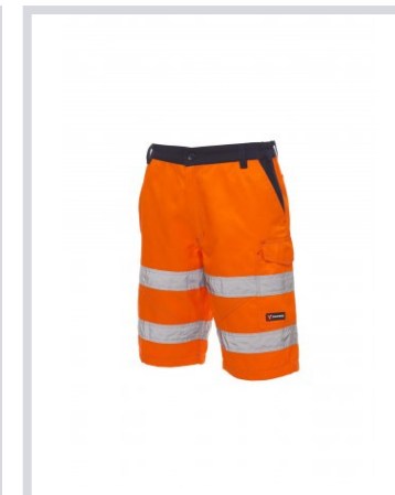
FLUORESZEKÁLÓ NAR ANCSSÁRGA/TENGE RÉSEKÉK