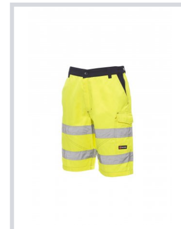
FLUORESZEKÁLÓ SÁR GA/TENGERÉSEKÉK