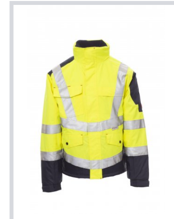
FLUORESzkÁLÓ SÁR GA/TENGERÉSZKÉK