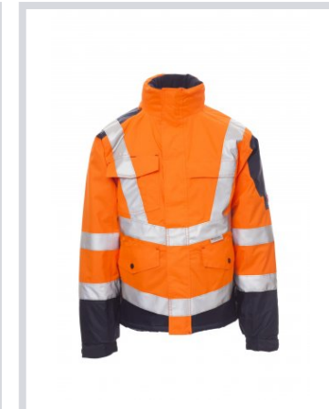
FLUORESzkÁLÓ NAR ANCSSÁRGA/TENGE RÉSZKÉK