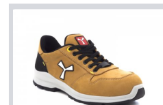
S0100 ASPEN SÁRGA