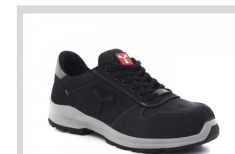
S0000 TOTÁL FEKETE