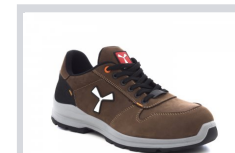
S1100 CSOKOLÁDÉBARN A