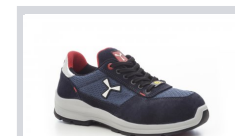
S0300 TENGERÉSZKÉK/S EAPORT