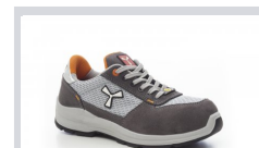
S1003 ACÉLSZÜRKE/ VILÁGOS SZÜRKE