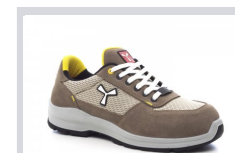
S0201 KHAKI/HOMOKSZÍ NŰ