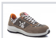
S0200 KHAKI/SZÜRKE TEREPSZÍNŰ