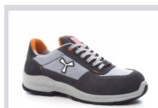
S1003 ACÉLSZÜRKE/ VILÁGOS SZÜRKE