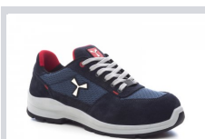
S0300 TENGERÉSZKÉK/S EAPORT