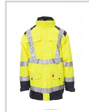
FLUORESZKÁLÓ SÁR GA/TENGERÉSZKÉK