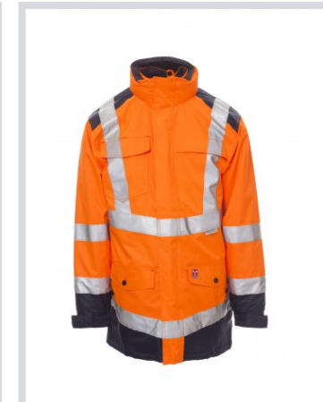
FLUORESZKÁLÓ NAR ANCSÁRGA/TENGE RÉSZKÉK