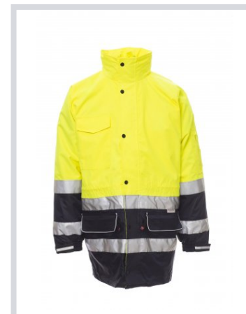
FLUORESzkÁLÓ SÁR GA/TENGERÉSKÉK