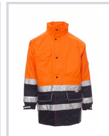
FLUORESzkÁLÓ NAR ANCSSÁRGA/TENGE RÉSKÉK